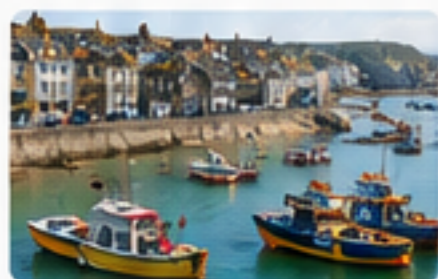
St. Ives Harbour

Verbringen Sie einen extra Tag in St. Ives und lassen Sie Ihre Reise bei einem Drink (Pint Bier – Korev ist das in Cornwall gebraute Bier oder einem Pint Cider – Rattler ist der Cider der in Cornwall hergestellt wird) revue passieren, bevor Sie Ihre Rückreise antreten.